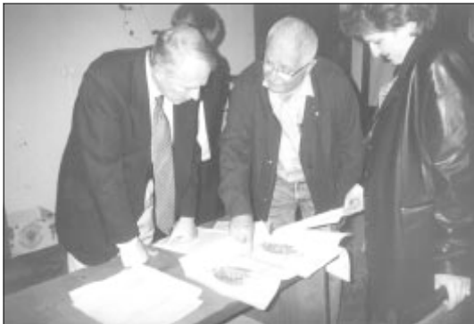
Знайомство з документами у Державному архіві Закарпатської області

У ході зустрічі Я. Перені торкнувся також низки інших питань, зокрема створення на базі Мукачівського замку філіалу Люксембургського культурологічного інституту, на діяльність якого, за