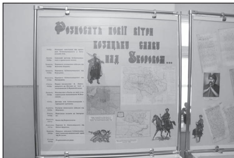
Експозиція виставки присвяченої 360-річчю Зборівської битви в Держархіві області

пунктах супліки, відповідь короля на супліку козаків та ін. Досить цікавою є інструкція елекційного сеймику Брацлавського воеводства від 11 жовтня 1949 року. В ній складається подяка королю і всім, хто брав участь у захисті Вітчизни поблизу міст Збаража та Зборова; роз'яснення загрози, що її становили 40 тисяч реєстрових козаків, розміщених у трьох воеводствах для Речі Посполитої, декларування необхідності подальшого ведення війни проти козаків.