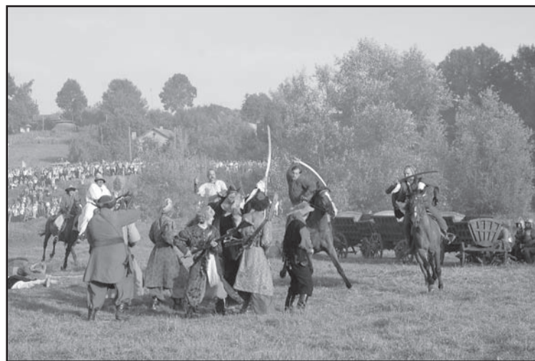
Під час реконструкції Зборівської битви. Білий берег, м.Зборів. 15 серпня 2009 року.

Згідно з договором встановлювався реєстр в 40 тисяч козаків у польському війську та євреям заборонялося перебувати на Київщині, Чернігівщині та Брацлавщині, де урядові посади дозволялося займати лише козацькій старшині та православній шляхті. Хоча всім учасникам повстання дарувалася