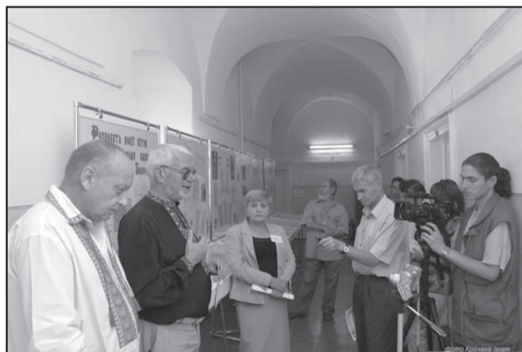
Під час відкриття виставки в Державному архіві Тернопільської області

Представлена угода про примирення між Річчю Посполитою та кримським ханом, конституція Варшавського сейму від 22 листопада 1949 року, на якому було ратифіковано Зборівський мирний договір, універсал польського короля Яна-Казимира від 19 січня 1950 року з повідомленням про затвердження сеймом Зборівського договору, пункти Зборівської та Переяславської угод, потреби війська запорозького, викладені в