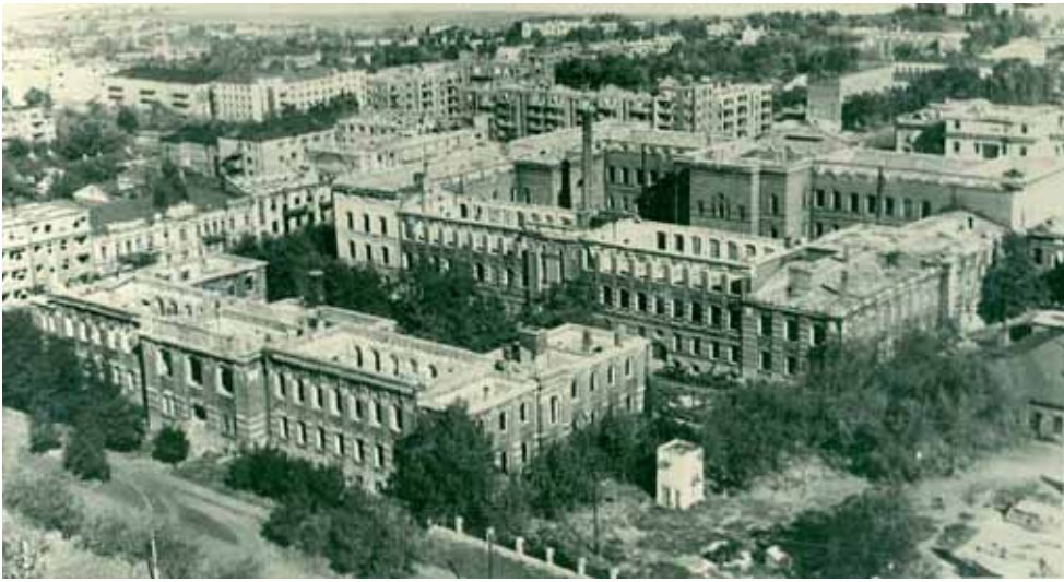
Прспект Карла Маркса після бомбардувань, м. Дніпропетровськ.