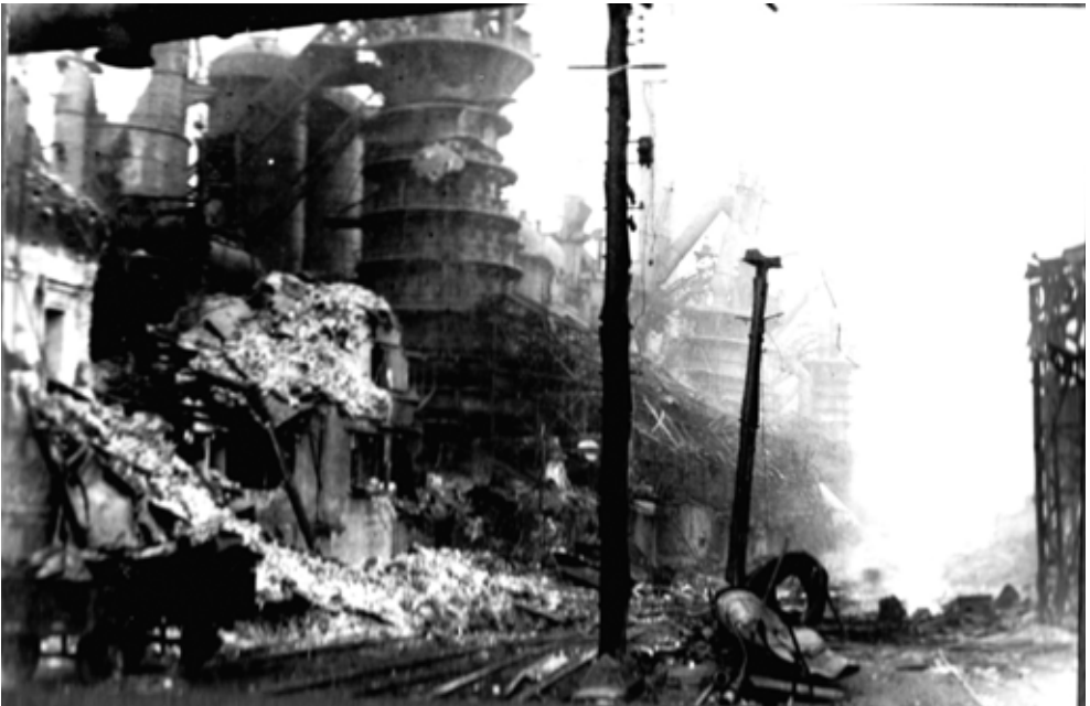
Завод ім. Петровського після бомбардувань. Фототека облархіву