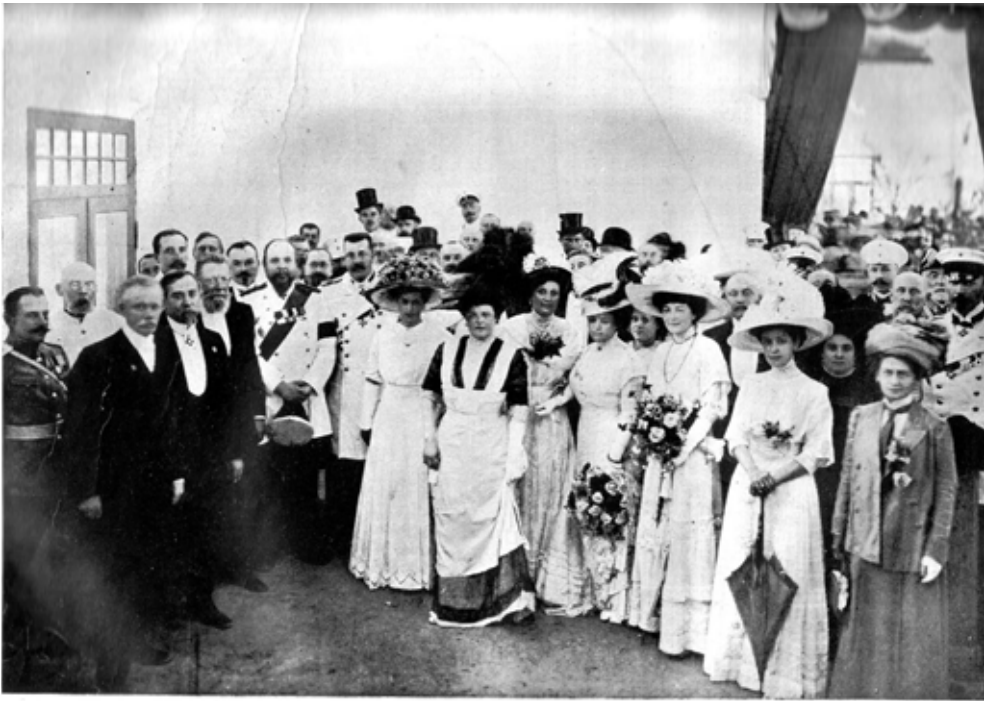
Група почесних гостей на торжествах открытия выставки.

Група почесних гостей на урочистому відкритті сільськогосподарської виставки 1910 року. Фототека облархіву