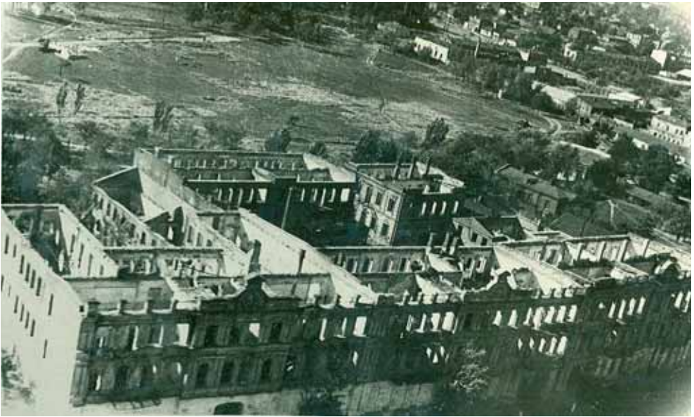
Проспект Карла Маркса після бомбардувань, м. Дніпропетровськ. Фототека облархіву