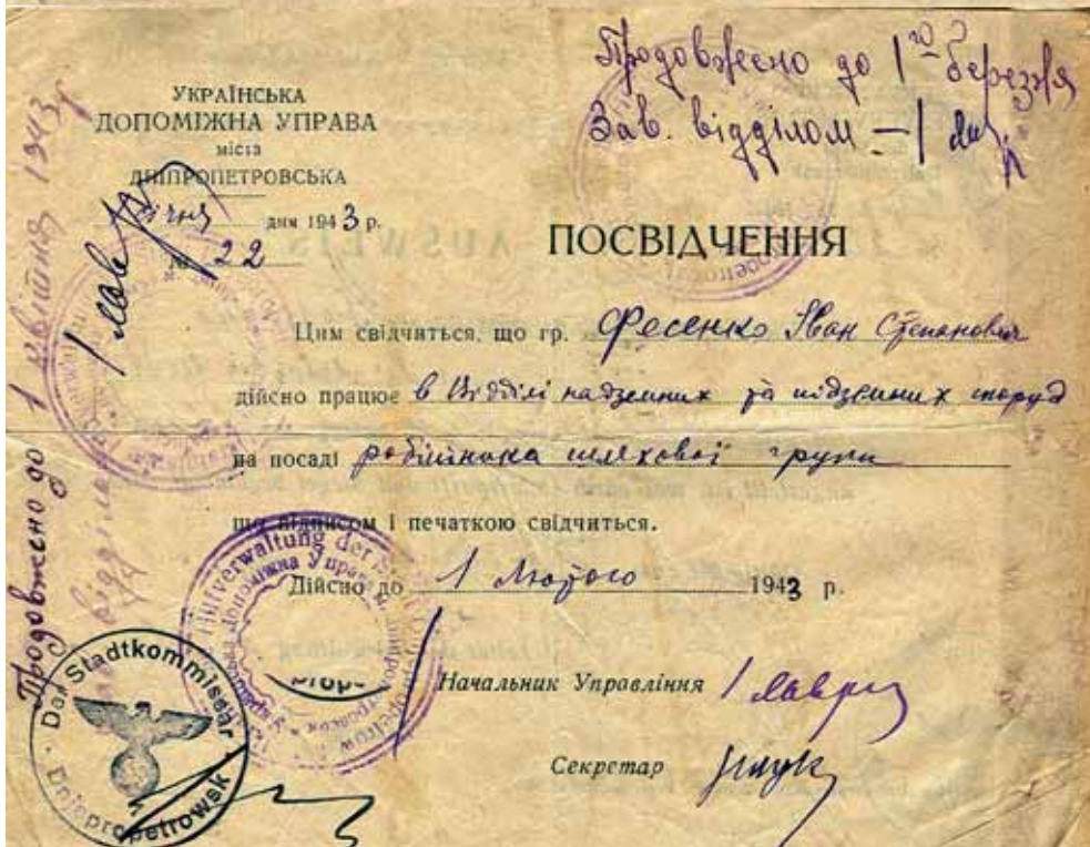
Посвідчення працюючого в м. Дніпропетровську в період окупації міста нацистськими окупантами. (ф. Р-2276, оп. 1, од. зб. 106, арк. 34,34 зв.)