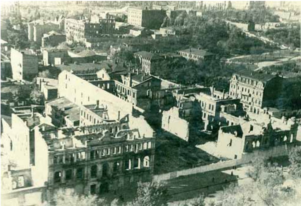
Прспект Карла Маркса після бомбардувань, м. Дніпропетровськ.