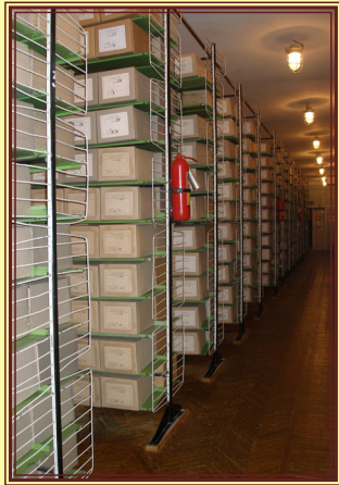
Архівне сховище ЦДАМЛМ України

Нині в ЦДАМЛМ України постійно зберігаються фонди 117 установ і організацій (116189 од. зб.).