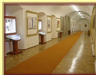
Виставкова зала ЦДАМЛМ України