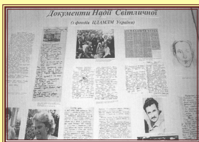
Нові надходження з США до ЦДАМЛМ України

З початку 1990-х рр. розгорнулося інтенсивне комплектування ЦДАМЛМ України документами зарубіжної україніки (Австралія, Бразилія, Великобританія, Канада, Німеччина, Росія, США, Франція, Чехія). Серед фондоутворювачів – визначні діячі української діаспори: письменник І. Багряний, художник М. Бутович, публіцист Р. Рахманний та ін.