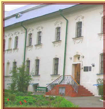
Приміщення ЦДАМЛМ України