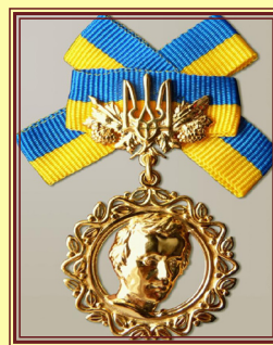
Почесний знак лауреата Національної премії України імені Тараса Шевченка. Одною з фондуютьвачів ЦДАМЛМ України