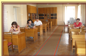
Читальна зала ЦДАМЛМ України