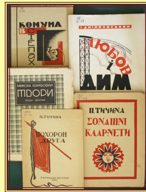
Книжкові зібрання ЦДАМЛМ України