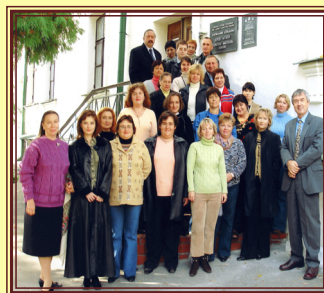
Колектив ЦДАМЛМ України