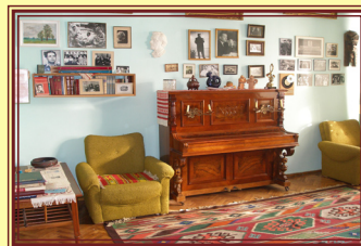
Меморіальний кабінет композитора П. І. Майбороди

Працівники ЦДАМЛМ України інформують установи і організації про склад і характер документів, виконують тематичні та соціально-правові запити, готують статті, огляди, збірники, радіо- та телепередачі, документальні виставки.