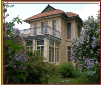
Відділ “Літературно-мистецькі Плюти”. Будинок О. Корнійчука

Окремим структурним під-розділом ЦДАМЛМ України є відділ “Літературно-мистецькі Плюти” в с. Плюти Обухівського району Київської області, до якого входить літературно-меморіальний будинок-музей визначного українського драматурга О. Корнійчука.