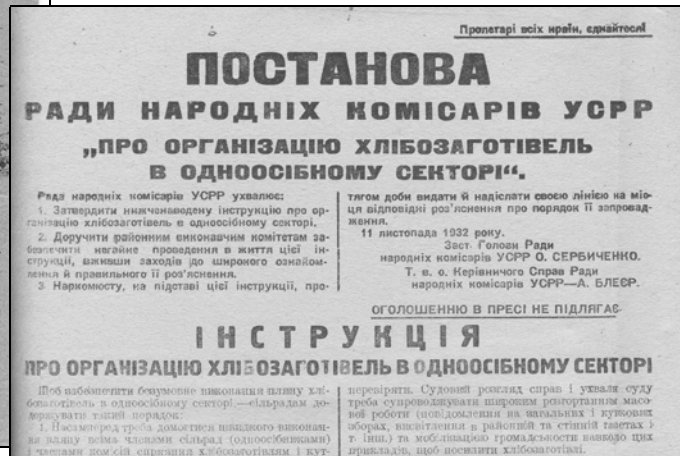
Постанова РНК УСРР «Про організацію хлібозаготівель в одноосібному секторі». 1932 р.