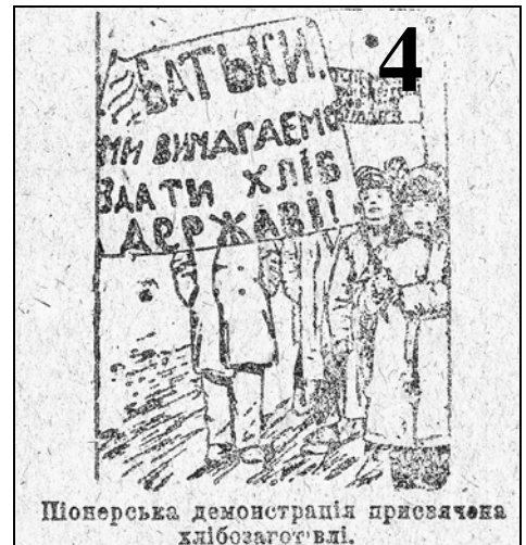
Генічеська районна газета «Комуна степу». 1932 р.

Требуется безотлагательная реальная помощь с Вашей стороны, которую мы настоятельно